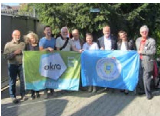
inleefreis Okra en ADR-Vlaanderen in 2018

Resultaat: Mogelijks rekruteer je nieuwe leden voor je ADR-groep, ontstaat er een nieuwe groep of is jullie groep beter gekend bij mensen in jouw buurt?